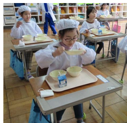
1年生給食もりもり食べています