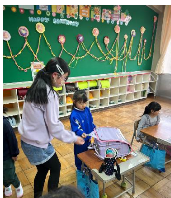
1年生を世話する優しく頼もしい6年生。

全校の子どもたちの様子を見ていますと、明るく元気な挨拶が校舎内外に響き渡り、全校集会等では、集中して話を聞いたり反応したりすることができる子どもたちだと感じています。子どもたちのよさを今後も伸ばしていきたいと考えています。