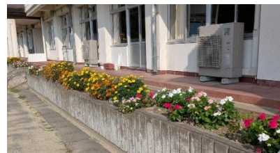
東京・桐朋学園から送られた花が きれいに咲いています。

夏休みのプール開放へのご協力をありがとうございました。8 日間のうち 2 日間の解放となりましたが、子どもたちが水遊びや水泳を楽しむことができました。今年も気候の異常さに命を守ることを優先せざるを得ない夏だと感じています。そのような中での対応に感謝申し上げます。